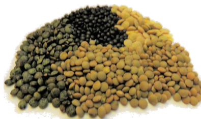
Différentes variétés de lentilles.