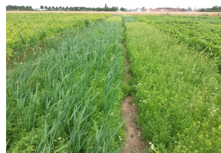
Associations lentille/avoine (à G) et lentille caméline (à D). Carvin juin 2016.

La culture en elle-même n'est pas compliquée à mener, mais il faut savoir gérer la récolte et l'après-récolte