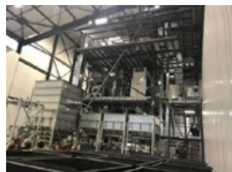
Chaîne de triage fin - Stockage - site de Marcilly - Biocer 2019

C'est là un point important car la plupart de ces marchés sont des