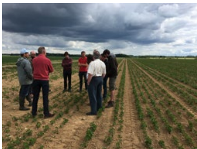
Tour de plaine soja - Juin 2020

En fonction de la qualité, et notamment de la teneur en protéines, le débouché se fera en alimentation humaine ou en alimentation animale. Le climat change et les variétés évoluent. Les étés chauds que nous connaissons permettent d'envisager la culture du soja variété 000 (très précoce) sur la quasi totalité des Hauts-de-France, hormis sur les zones les plus froides du Pas de Calais. Par contre, le soja ne supporte pas la sécheresse. Les rendements de 2020, aux alentours de 10-15 qx/ha étaient décevants par rapport à ceux de 2016-2019 : 20-25 qx/ha. Marge brute visée : 1200 euros/ha. Cette culture trouve aussi un débouché en C2 (alimentation animale) avec un niveau de marge plus faible mais toutefois intéressant (un des seuls produits où le prix du C2 est proche du prix du bio).