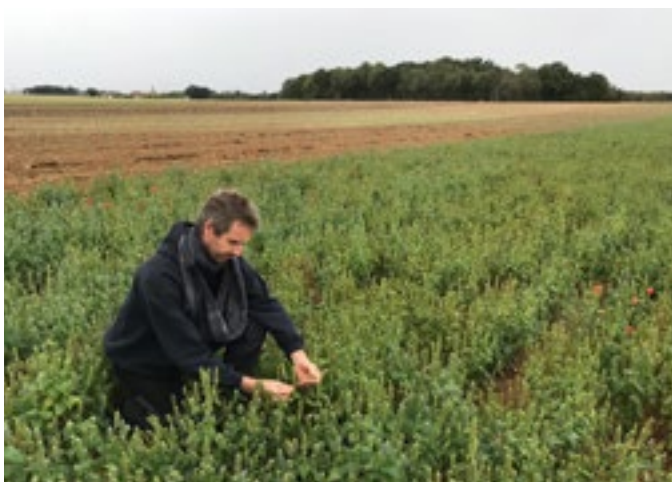
Parcelle de Chia - BIOCER