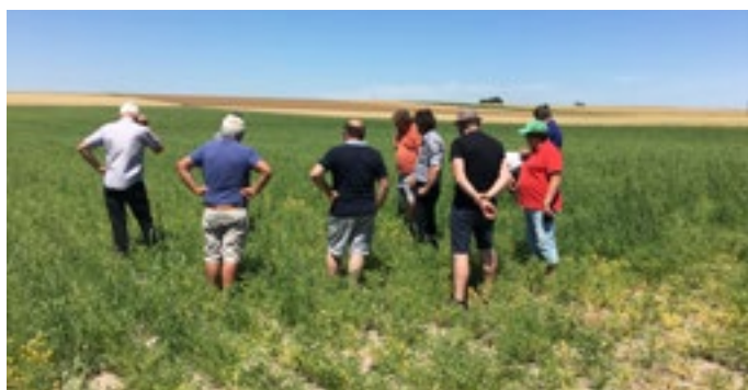
Tour de plaine pois chiche - Juin 2020 - Biocer

Nouveau venu dans les Hauts-de-France depuis deux ans, le pois chiche tire bien son épingle du jeu à la faveur des étés chauds et secs que nous connaissons depuis quelques années. Particularité de cette légumineuse : il ne faut pas hésiter à la fertiliser. En effet, l'inoculum n'est pas homologué pour un usage en AB en France, et, sans inoculum, la plante ne développe pas de nodosités. Idéalement, il faut semer avec un écartement de 25 à 45 cm pour pouvoir biner. Marge brute visée : 1200 euros/ha.