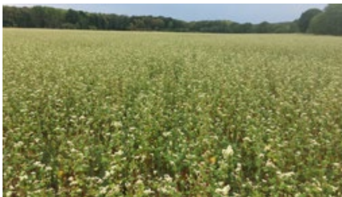
Parcelle de Sarrasin en fleurs - Juillet 2020- BIOCER