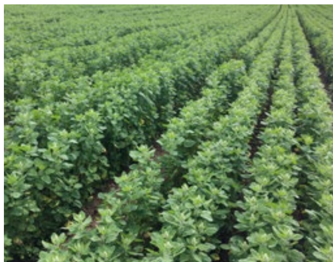
Parcelle de Quinoa près de Cambrai (juin 2019) chez un adhérent de Biocer

Marge brute/ha visée : 1800 euros/ha. Le quinoa demeure une culture délicate et assez aléatoire. Il est conseillé de rester raisonnable au niveau des surfaces emblavées. La prise de risque est assez importante pour le producteur, et il vaut mieux réussir 3 ha de quinoa que d'en rater 10 !